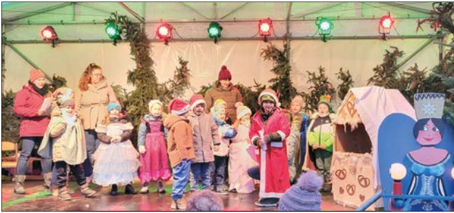
Ihr Team vom Kindergarten „Kastanienhof“

Zu Recht bekamen die jungen Darsteller einen riesigen Applaus. Wie mutig waren doch diese kleinen Kinder, auf so einer großen Bühne teilweise sogar solo zu singen und zu schauspielern. Dies verlangt nicht nur einen riesigen Applaus, sondern auch unseren größten Respekt.